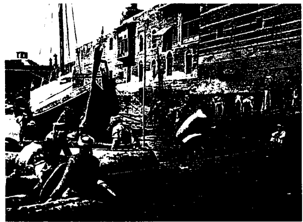
פריקת סחורות מסירת גופא, בגדאד, 1925

בשנת 1902 גילה מהנדס מניו זילנד, ויליאם ד'ארסי, כי עיראק עשירה באוצרות נפט גדולים; בשנת 1914 קיבלה "חברת הנפט התורכית" זיכיון לחיפוש נפט מהממשלה העות'מאנית; בשנת 1927 נמצא נפט בכמויות גדולות ליד כרכוך, וכעבור שנתיים גם בכוויר (כ-90 קילומטר מדרום למוצל, בגדה המזרחית של החידקל). הצלחת קידוחי הנפט נתנה תנופה להתפתחות תעשיית הנפט בעיראק, אשר יחד עם פתיחת תעלת סואץ הביאה למעורבות אירופית, בעיקר בריטית וצרפתית, בכל תחומי הכלכלה: במסחר, בתעשיית הנפט, בהקמת