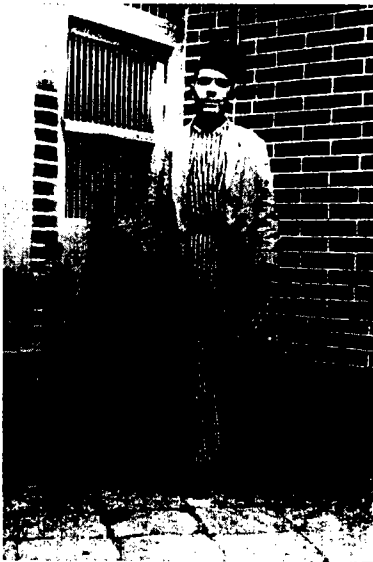
מוכר עופות יהודי בשוק בבגדאד, שנות העשרים של המאה העשרים

טבלה 3: התפלגות ענפית של גברים באזורים עירוניים בעיראק (באחוזים)