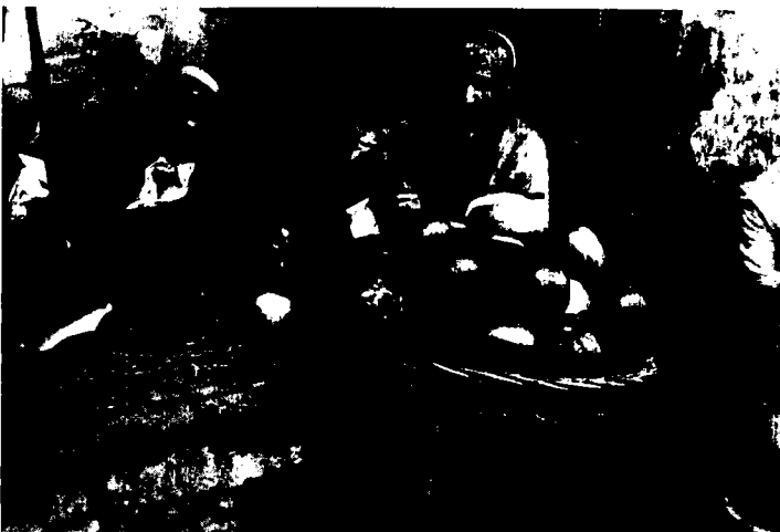
מוכר אבטיחים בשוק "חנני", הרובע היהודי, בגדאד, המחצית הראשונה של המאה העשרים

1. רמת הפיתוח – רמת הפיתוח הכלכלי באזור הצפון הייתה נמוכה משאר אזורי עיראק, עקב הסטת נקודת הכובד הכלכלית מהצפון לדרום ולמרכז. פתיחתה של תעלת סואץ והמעבר ממסחר יבשתי