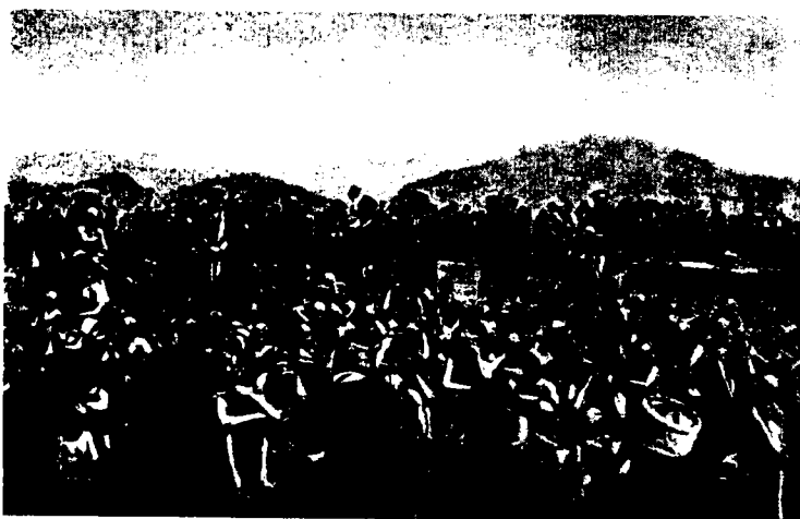
עולי רגל שיעים בדרכם לקבר חסין בכרבלא, עיראק, המחצית הראשונה של המאה העשרים המאמינים נוהגים להכות עצמם ביום העשורה עד זוב דם, לאות הזדהות עם סבלו של חסין, שנהרג בקרב כרבלא.