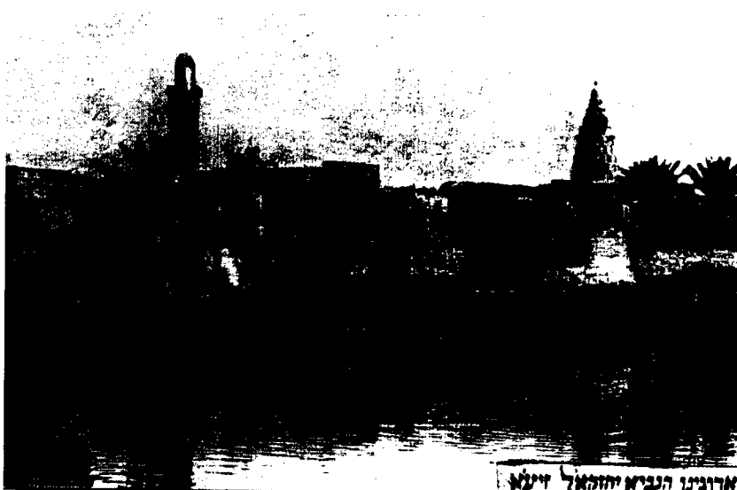
ארונינו הנביא יחזקאל זיילא