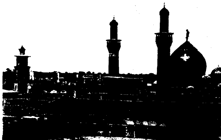
קבר חסין בן עלי בכרבלא, עיראק, המחצית הראשונה של המאה העשרים

במסגרת המאמץ לחקות את המשטרים הפאשיסטיים באירופה, הוקם בעיראק באוקטובר 1935 ארגון נוער צבאי למחצה בשם "עלומים" (אַלְפִּתְוָה). ארגון זה נועד להקנות הכשרה צבאית לתלמידי בתי הספר התיכוניים והמקצועיים ולתלמידי הסמינר למורים, לחנכם למשמעת, לכוח עמידה ועוד. הארגון הוקם מלכתחילה כארגון וולונטרי, אך כעבור שנים מספר, במאי 1939, התפרסמה תקנה שחייבה את תלמידי בתי הספר